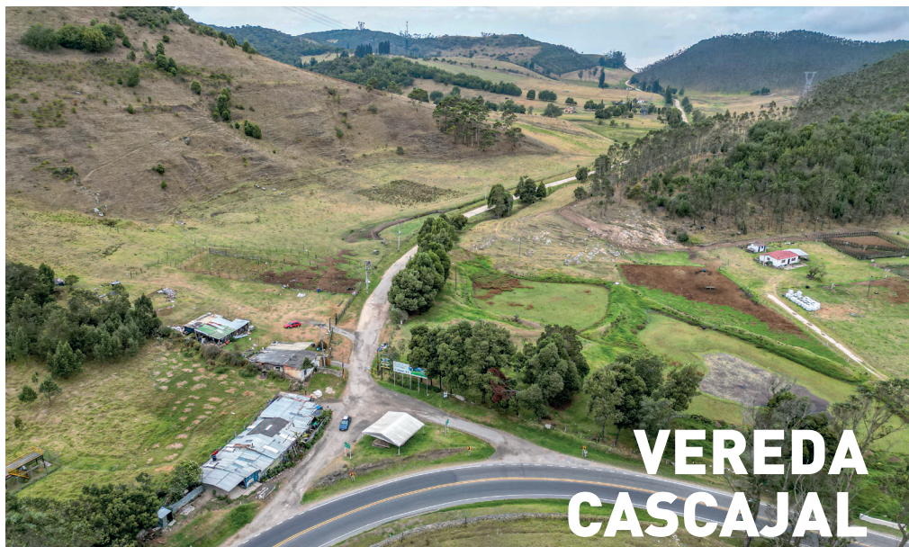
Intervención de vías terciarias.

Nuestra inversión en la vereda Cascajal :